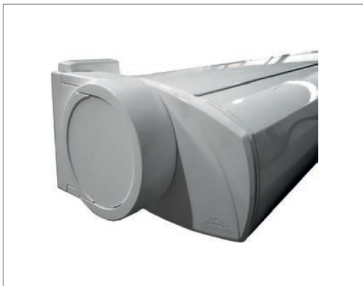
Profiles en aluminium