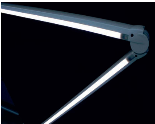
Illumination LED intégré (en option)