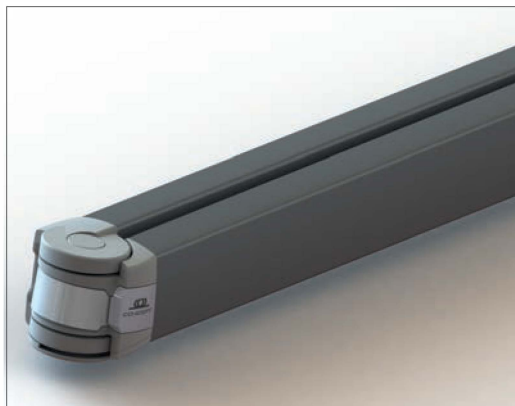
Bras Concept avec chaîne en acier Inox